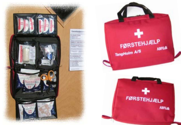
Alle tasker kan anvendes ophængt

Der er mulighed for genopfyldning via vores hjemmeside.